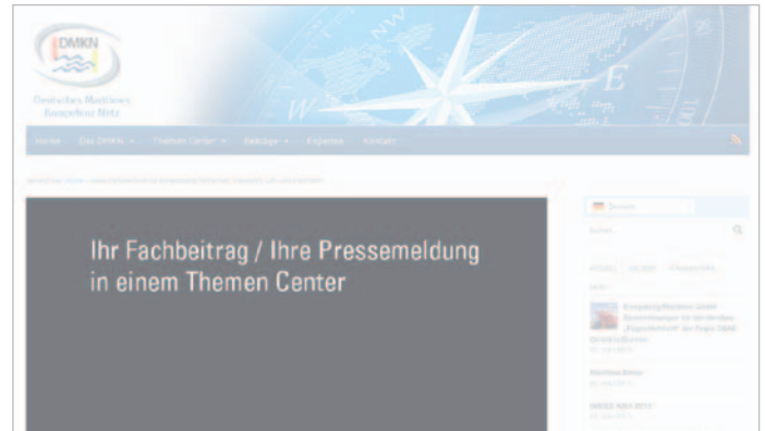
Platzierung des Beitrags in einem definierten Themen Center wie z. B. www.DMKN.de » Themen Center » Marine & Rüstung

Für den News-Slider wird mindestens eine Abbildung benötigt. Bildnutzungsrechte müssen für diesen Zweck geklärt sein!