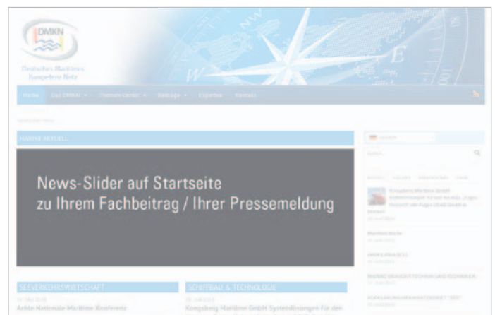
Hervorhebung des Beitrags mit einem News-Slider auf der Startseite www.DMKN.de