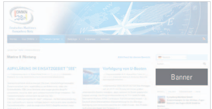
Platzierung des Werbebanners in einem definierten Themen Center wie z. B. www.DMKN.de » Themen Center » Marine & Rüstung