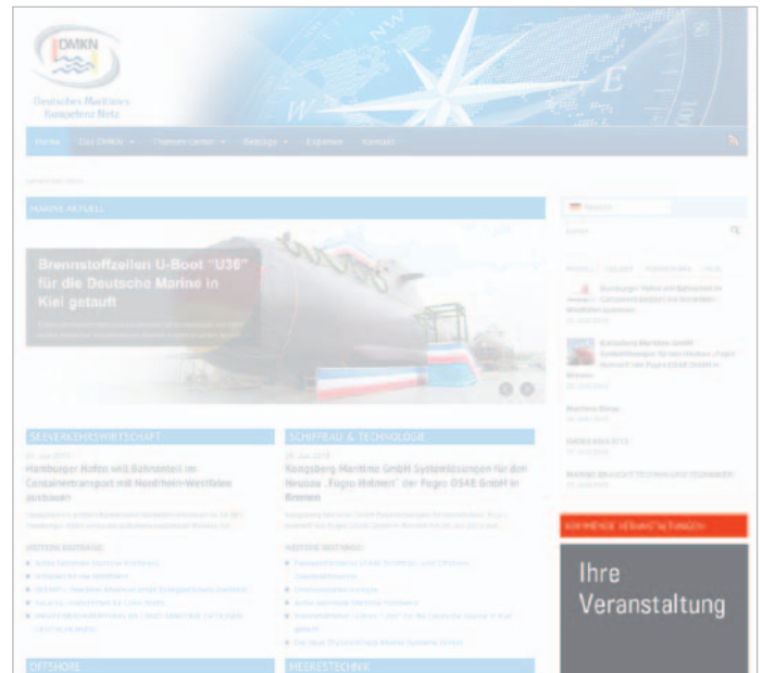
Veranstaltung erscheint in der Rubrik „Kommande Veranstaltungen“ in der rechten dauerpräsenten Spalte auf www.DMKN.de

Einbindung einer Veranstaltung in den DMKN-Veranstaltungskalender. Die aktuellsten Veranstaltungen werden in der dauerpräsenten rechten Spalte (Sidebar) angezeigt.