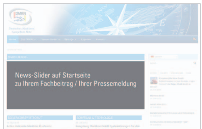
Hervorhebung des Beitrags mit einem News-Slider auf der Startseite www.DMKN.de