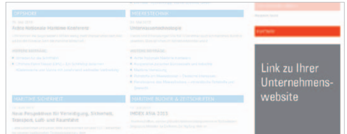
Partnerlink erscheint in der Rubrik „Partner“ in der rechten dauerpräsenten Spalte auf www.DMKN.de

Integration eines Partnerlinks inklusive Verlinkung zur Unternehmenswebsite in der dauerpräsenten rechten Spalte.