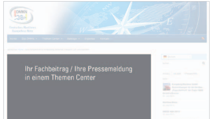
Platzierung des Beitrags in einem definierten Themen Center wie z. B. www.DMKN.de » Themen Center » Marine & Rüstung

Für den News-Slider wird mindestens eine Abbildung benötigt. Bildnutzungsrechte müssen für diesen Zweck geklärt sein!