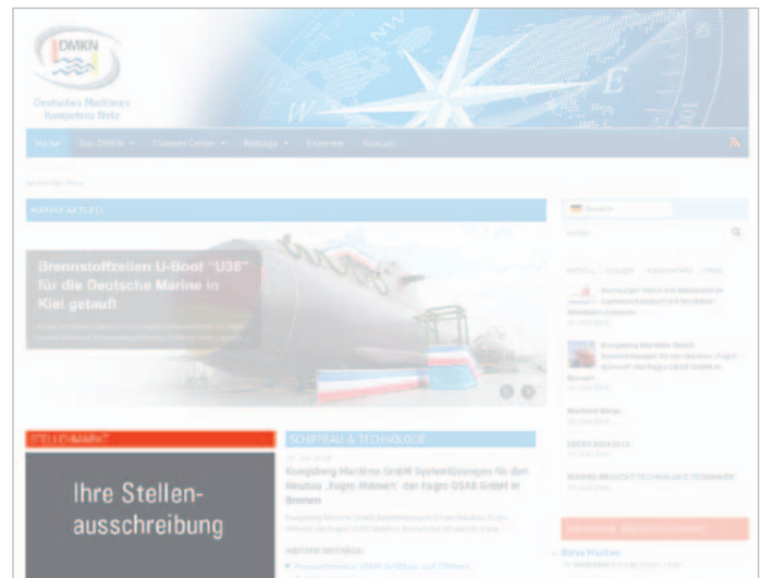
Stellenausschreibung erscheint als Teaser in der Rubrik „Stellenmarkt“ auf der Startseite www.DMKN.de

Die Dauer der Präsenz einer Stellenanzeige auf www.dmkn.de wird individuell vereinbart.