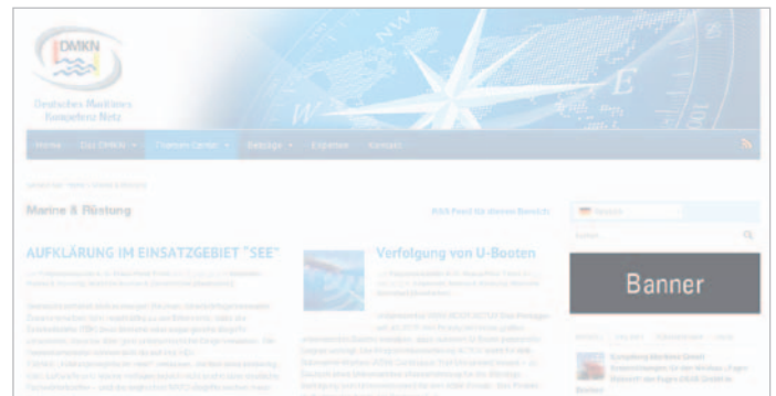
Platzierung des Werbebanners in einem definierten Themen Center wie z. B. www.DMKN.de » Themen Center » Marine & Rüstung