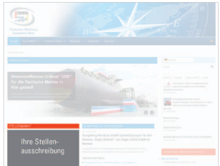
Stellenausschreibung erscheint als Teaser in der Rubrik „Stellenmarkt“ auf der Startseite www.DMKN.de

Die Dauer der Präsenz einer Stellenanzeige auf www.dmkn.de wird individuell vereinbart.