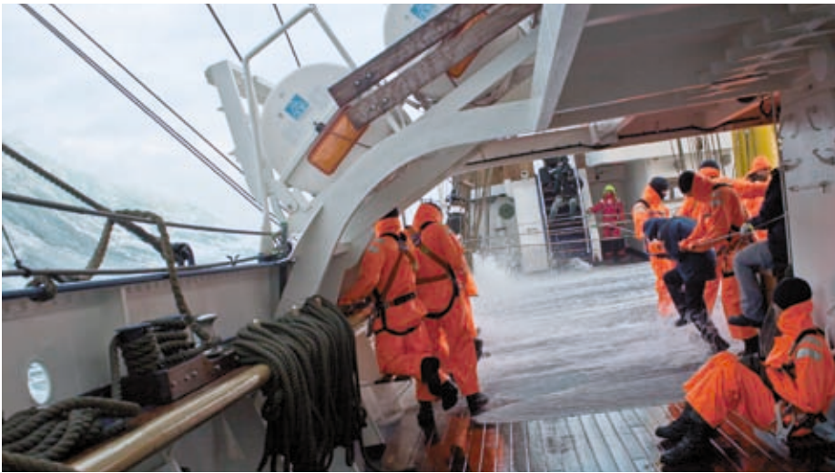
Seemännische Ausbildung an Bord – gemeinsam den Auftrag erfüllen.

der GORCH FOCK soll zu einem späteren Zeitpunkt wieder aufgenommen werden und insbesondere erst nach einer abschließenden Überprüfung der sicherheitstechnischen Aspekte an der Takelage der GORCH FOCK.