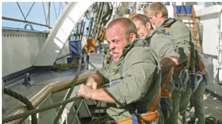
Seemännische Ausbildung – im Team und manchmal schweißtreibend.

Nach einer Entscheidung der Marineführung wird die „Seemännische Basisausbildung“ (SB) an Bord der GORCH FOCK erst wieder mit der Crew VII/2012 weitergeführt werden. Dazu wurde seitens des Marineamtes ein Alternativplan erarbeitet, mit dem die seemännische Basisausbildung auch ohne – zumindest vorübergehende – Einbeziehung der GORCH FOCK möglichst effektiv erreicht werden kann. Die erneute Ausbildung auf