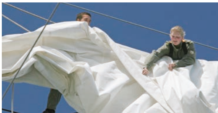
Seemännische Ausbildung – gefahren-geneigt, aber erlernbar und erlebnisreich.