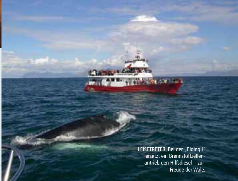
LEISETRETER. Bei der „Elding I“ ersetzt ein Brennstoffzellenantrieb den Hilfsdiesel – zur Freude der Wale.

Wasserstoff-Brennstoffanlagen als Antrieb von Fahrzeugen und Schiffen. SMART H 2 begann im März 2007 und läuft bis 2010.