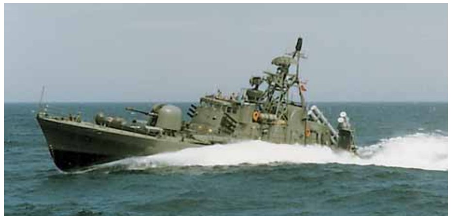
WILLEMOES (oben) und ESBERN SNARE (unten)

Trotz zu jeder Zeit bestehender finanzieller Engpässe wurde das Schiffsmaterial in mehreren Wellen in den 50er (hier mit ame-