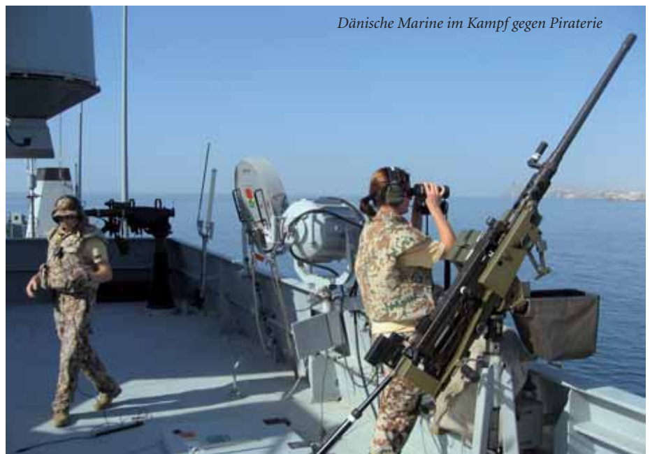
Dänische Marine im Kampf gegen Piraterie

Nach 45 Jahren Konfrontation in heimischen und nordatlantischen Gewässern wurden der dänischen Marine plötzlich neue und unerwartete Aufgaben gestellt. Das dänische Parlament fasste den Beschluss, militärisch an der Befreiung Kuwaits mitzuwirken und entsandte die Korvette OLFFERT FISCHER in den Persischen Golf. Dieser Beschluss läutete eine Änderung in der Außenpolitik ein, die 2003 das U-Boot SÆLEN und erneut die OLFFERT FISCHER in den Golf sandte. Dem vorausgegangen waren u.a. Einsätze in der Adria während des jugoslawischen Krieges, im Mittelmeer zur Terror- und in der Karibik zur Rauschgiftbekämpfung. Das Kampfunterstützungsschiff ABSALON war zweimal am Horn von Afrika