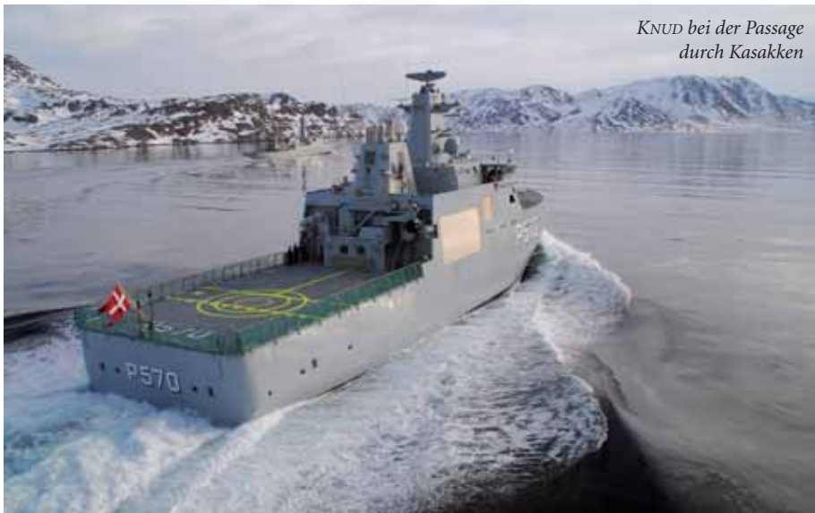
KNUD bei der Passage durch Kasakken

rikanischer Finanzhilfe 1953), 60er und 80er Jahren erneuert. Erstmals eingeführt in die Flotte wurde die Schnellbootwaffe als Lehre aus den Weltkriegserfahrungen und blieb bis 2000 eine wichtige Komponente. Nacheinander erfüllten die GLENTEN-, FLYVEFISKEN-, SØLØVEN-, FALKEN- und WILLEMØES-Klassen diese Rolle. Korvetten und Fregatten bildeten das Rückgrat der Überwasserkampfkraft. TRITON, HOLGER DANSKE, ESBERN SNARE, PEDER SKRAM, NIELS JUEL und ab 2012 IVER HUITFELD waren und sind die Namenspaten dieser Klassen. Wichtig für die vorgeschobene Aufklärung und Abwehr waren die U-Boote. Zunächst standen nur drei in der SPRINGEREN-Klasse (ex. britische U- bzw. V-Klasse) zur Verfügung. Ihnen folgte die DELFINEN-, NARHVALEN- und TUMLEREN-Klasse.