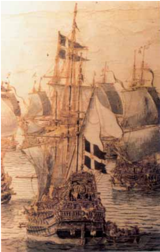
Admiralsschiff OLDENBORG in der Schlacht bei Fehmarn

lichte Flotte vorzugsweise Konvoidienste für Handelsschiffe nach Westindien und Afrika aus. Zweimal wurden Flottillen an die nordafrikanische Küste entsandt, um dänische Sklaven freizukämpfen bzw. auszulösen.