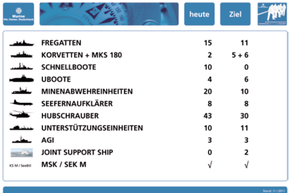
Zielstruktur der seegehenden Einheiten und der Marineflieger sowie der landgebundenen Kräfte.