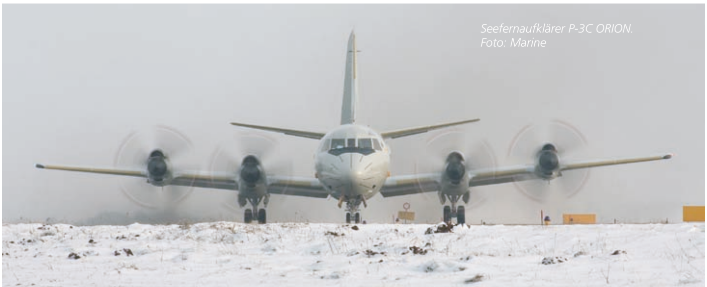
Seefernaufklärer P-3C ORION.

Der Dienst in der Marine ist insbesondere von fachspezifischen Aufgaben an Bord geprägt. Daher benötigen wir auch zukünftig hochqualifiziertes Personal, dem wir aber auch eine Vielzahl an