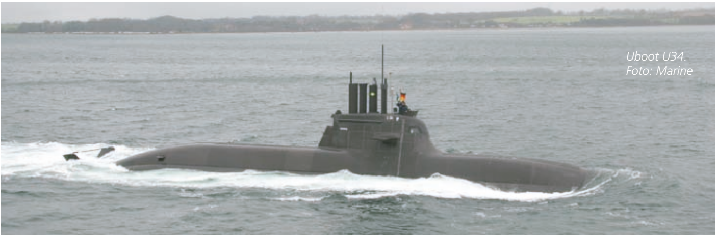
Uboot U34.

Qualifizierungs- und Weiterbildungsmöglichkeiten werden bieten können. Was die Haushaltslage betrifft, haben Sie natürlich Recht. Wir stehen alle unter dem Einfluss, sparen zu müssen. Trotzdem hoffe ich, dass einige Maßnahmen zur Attraktivitätssteigerung umgesetzt werden können, wie beispielsweise die Einführung eines Prämiensystems zur Gewinnung gesuchter Fachkräfte oder die Verbesserung der Vergütung für