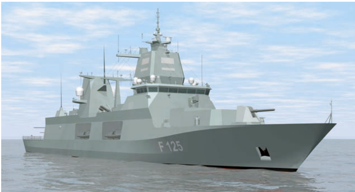
Künftige Fregatte F 125