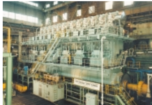
Der weltweit stärkste Dieselmotor der Firma Sulzer in Zwölfzylinderversion mit einer Leistung von 65.800 kW

Limitierender Faktor für das Größenwachstum der Containerschiffe sind derzeit unter wirtschaftlichen Aspekten die Antriebsanlagen. Die größten zurzeit verfügbaren Zwölfzylinder-Motoren leisten max. 69.000 kW und sind damit ein adäquater Antrieb für ein Postpanamax-Schiff mit etwa 8.000 Stellplätzen und