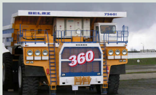
Der neue 360-Tonnen-Truck von Belaz wird künftig von einem 20-Zylinder-Motor der Marke MTU angetrieben.

Mit einem Auftrag über insgesamt neun Gasmotoren-Aggregate inklusive übergeordneter Anlagensteuerung liefert MTU Onsite Energy aus seinem Augsburgener Werk zum ersten Mal Anlagen zur Wärme- und Stromerzeugung nach Frankreich. Zum Einsatz kommen die Kraft-Wärme-Kopplungsaggregate mit gasbetriebenen Motoren des Typs 16V 4000 L62 zukünftig in den Blockheizkraftwerken der Automobilwerke von Peugeot und Smart, wo sie alte Anlagen ersetzen. In Mühlhausen und Hambach wird die anfallende Abwärme in Form von Warmwasser und Dampf umweltfreundlich und energieeffizient für Heizzwecke genutzt, der Strom in das öffentliche Netz eingespeist. Auftraggeber ist der französische Energieanlagenbauer SDMO mit Hauptsitz in Brest. Mit diesem Auftrag unterstreicht Tognum seine Strategie, internationale Industriekunden mit Kraft-Wärme-Kopplungs-Anlagen zu beliefern. (eb)