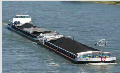
Das Binnenschiff Navigare wird Anfang des Jahres 2011 einen 12V 4000 M53-Ironmen-Motor erhalten.

Vom 11. bis 13. August öffnet die Messe Navalshore im Convention Center SulAmérica in Rio de Janeiro ihre Pforten für Besucher aus aller Welt. An Stand 44 der größten brasilianischen Messe für die Schiffbau- und Offshore-Industrie stellt MTU die neuesten Lösungen im Bereich Antriebstechnologie vor. Neben der nationalen Baureihe 199 (6R 199 TB60) wird auch eine 8-Zylinder-Version des Arbeitsschiffmotors der Baureihe 4000 Ironmen zu sehen sein. Die Motoren der Baureihe 4000 wurden speziell für den Einsatz auf Arbeitsschiffen unter härtesten Einsatzbedingungen konzipiert. Dies ist insbesondere in Brasilien von großer Bedeutung, da die Anzahl an Tankerbestellungen hier die vierthöchste weltweit ist und großes Potential für Projekte wie Ölplattformen, Massengutfrachter, Schubschiffe und Schlepper besteht. (eb)