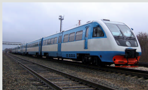
Achtung, Abfahrt! Die Triebwagen der russischen Staatsbahn werden von Metrowagonmash standardmäßig mit MTU-PowerPacks ausgerüstet.

Mehr als 19 Stunden pro Tag sind die Muldenkipper des russischen Steinkohleförderungsunternehmens Kuzbassrazrezugol im Einsatz. Für die nötige Leistung sorgen neben den 12- und 16-Zylinder-Versionen der MTU-Baureihe 4000 erstmals die robusten 20-Zylinder-Motoren: der osteuropäische Fahrzeug-Hersteller Belaz bestellte fünf der schnelllaufenden Großmotoren für seine neuesten 360-Tonnen-Trucks. Überzeugt hatten vor allem der wirtschaftliche Kraftstoffverbrauch, die niedrigen Wartungskosten sowie die hohe Verfügbarkeit. Insgesamt hat MTU seit 2008 bereits mehr als 70 Motoren der Baureihe 4000 an Belaz geliefert. Diese treiben Minentrucks in Russland, China, Südafrika und Chile an. (eb)