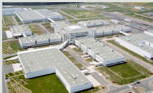
Im Smart-Werk Hambach sichern gasbetriebene Kraft-Wärme-Kopplungsaggregate von MTU Onsite Energy die unabhängige Versorgung mit Energie.

Seit 2009 ist der San Francisco International Airport in Kalifornien (USA) der zweitwichtigste Flughafen in Kalifornien und zehntgrößte Flughafen der USA. Derzeit wird Terminal 2 umfassend umgebaut und soll nach seiner Fertigstellung 2011 die beiden großen Fluglinien American Airlines und Virgin America beherbergen. Damit Stromausfälle in diesem Terminal nicht zu Flugverspätungen führen, entschied sich das mit dem Umbau beauftragte Unternehmen für zwei 770 Kilowatt starke Diesel-Gensets der Baureihe 2000 von MTU Onsite Energy als Notstromversorgung für dieses Terminal. Hierbei handelt es sich um die ersten der neuen, globalen Konfigurationen, die in Nordamerika verkauft werden; der Einbau ist noch für dieses Jahr vorgesehen. (jr)