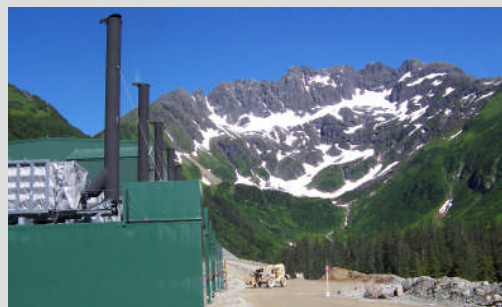
Die zur Abgasreinigung nötige Harnstoffwasserlösung wird in einer mobilen Anlage hergestellt.