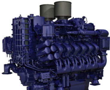
Ein echter Ironmen: Der Arbeitsschiffmotor der Baureihe 4000 (im Bild eine 12-Zylinder-Variante) ist speziell für seinen Einsatz optimiert.

Der Newsletter der Marken MTU und MTU Onsite Energy | Ausgabe August 2010