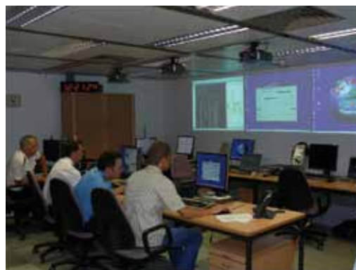
Control Center TAUES

Weiterhin werden in dieser Gruppe Informationen über alle fliegenden, schwimmenden und landgestützten Plattformen der Welt gesammelt und datentechnisch so aufbereitet, dass den Einsatzsystemen Vergleichsdaten für die Sensorerfassungen