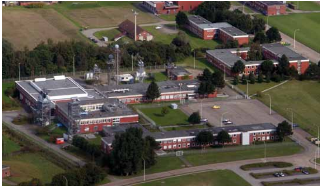
Luftbild des Kommandos Marineführungssysteme

Im Rahmen der Systementwicklung entscheidet eine konsequente Analyse der Anwenderforderungen und möglicher Lösungswege maßgeblich über den Erfolg oder Misserfolg eines Projektes. Wissenschaftliche Untersuchungen haben gezeigt, dass die überwiegende Anzahl von Fehlern in der Softwareerstellung bereits in der Analyse entstehen. Fehler aus frühen Phasen