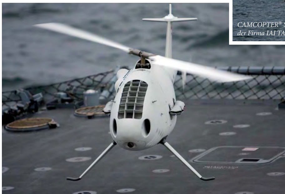
CAMCOPTER® S-100 im Flug

gründen redundant über den Primär- und einen Sekundärdatenlink. Sofern es zur Auftrags-erfüllung erforderlich ist, kann von der Bodenkontrollstation aus in den vorgeplanten Missionsablauf eingegriffen werden, um die Flugroute der neuen Lage entsprechend anzupassen. Das System verfügt über intelligente Notfallprozeduren, die im Zuge der Missionsplanung auftrags- und lagebezogen vorgeplant werden können.