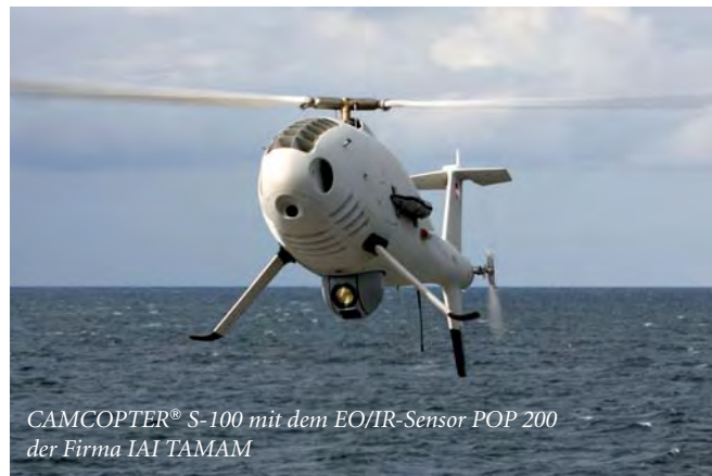
CAMCOPTER® S-100 mit dem EO/IR-Sensor POP 200 der Firma IAI TAMAM

Zur Untersuchung der Eignung des CAMCOPTER® S-100 für den Einsatz und Betrieb auf seegehenden Einheiten der Deutschen Marine wurden im vergangenen Jahr drei einwöchige Flugversuchskampagnen auf den Einsatzsystemen K130 MAGDEBURG