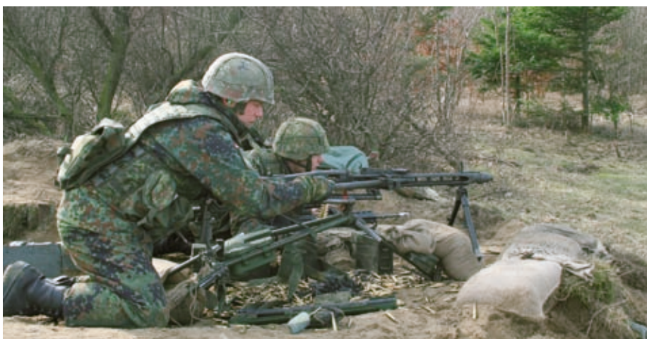
Die Ausbildung an der Waffe hat einen hohen Stellenwert.