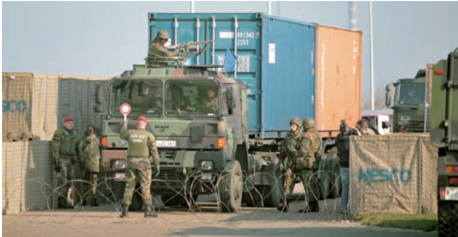
Soldaten der Marineschutzkräfte kontrollieren mit Unterstützung von Feldjägern Fahrzeuge an einem Checkpoint.