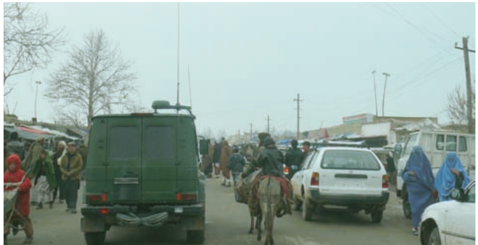
Auch das ist ein Einsatzszenario für Marineschutzkräfte.