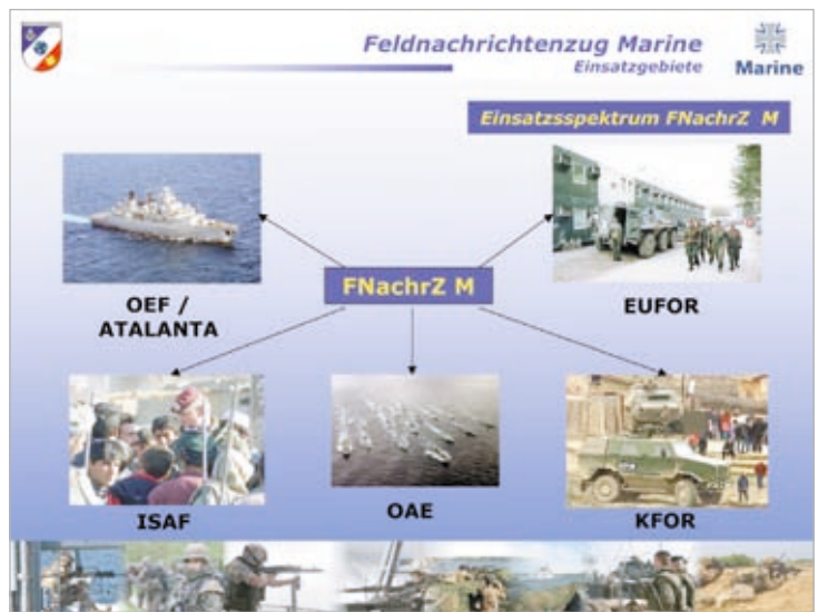
Aufgaben des Feldnachrichtenzugs der MSK Grafik: MSK

Der Feldnachrichtenzug Marine (FNachZ M) stellt innerhalb der Deutschen Marine eine Besonderheit dar. Zu den Aufgaben gehört die Herstellung und Pflege eines engen Kontaktes zur Bevölkerung des Einsatzlandes, um durch so genannte Gesprächsaufklärung die Stimmung im Lande aufzunehmen, auszuwerten und in das Lagebild vor Ort einzubringen.