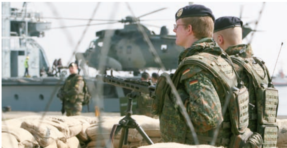
Soldaten eines HPE sichern den Pierbereich einer Marineeinrichtung.