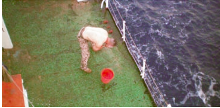
Das Leben an Bord ist zusätzlich mit großen Entbehrungen, oft über lange Zeiträume, verbunden.

Vessel Protection Detachments haben einen ähnlichen Auftrag, allerdings nehmen sie diesen als Schutzteam an Bord von Handelsschiffen wahr. Dabei beraten die VPD unter der Führung eines Offiziers die Schiffsführung in Fragen der Absicherung und schützen aktiv im Bedarfsfall. VPD werden zumeist mit Unterstützung von Hubschraubern durch Abwinchen eingesetzt. Im Rahmen der EU-Operation ATALANTA sind VPD zum Schutz von Schiffen des World Food