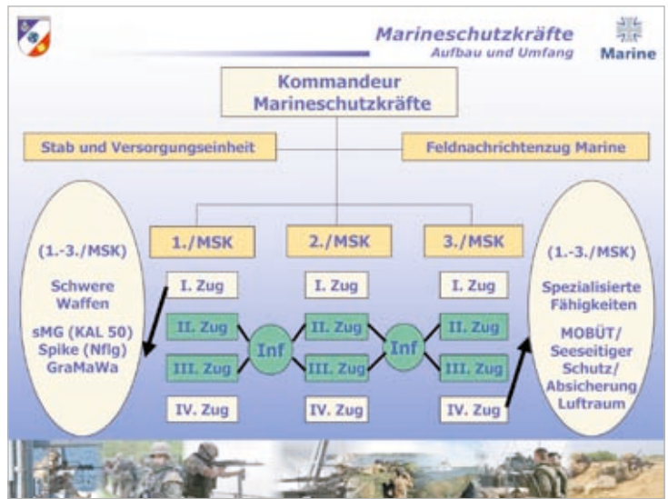
Aufbau und Umfang der Marineschutzkräfte Grafik: MSK